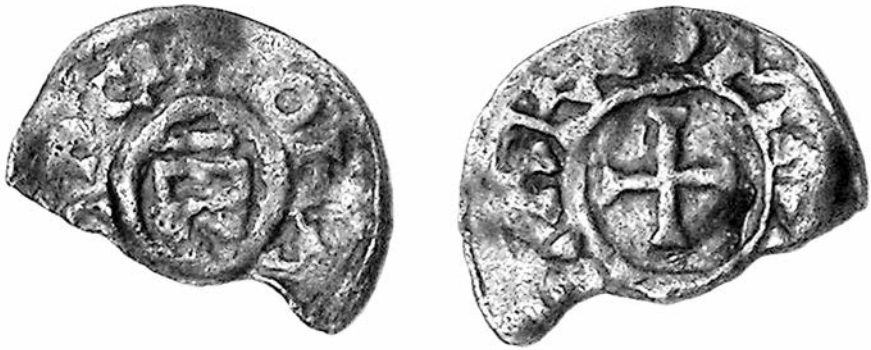
Ampliació invertida de l'òbol. Es llegeix ...ARCINONA... a l'anvers, i CAR[LO]MA... al revers.

Carloman II fou el fill mitjà de Lluís II el Tartamut. Ocupà el tron de França occidental entre 879 i 884, primer associat al seu germà Lluís III el Jove (entre 879 i 882), i finalment en solitari, només dos anys (entre 882 i 884). El fet que durant el breu regnat de Carloman II s'haguessin pogut batre monedes a Barcelona duent el seu nom no és extraordinari. Coneixem monedes –diners i òbols– a nom de Carloman II fabricades a Arles, Auxerre, Laignes, Limoges, Melle, París, Sustancione , Tolosa i Troyes. 7 I sabem també que Carloman fou plenament reconegut pels comtats catalans. 8